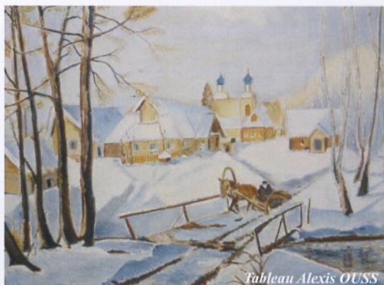
Tableau Alexis OUSS